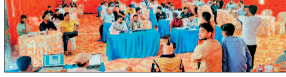
हरिभूमि न्यूज ▶▶ पखांजुर

क्षेत्र के क्रिकेट प्रेमियों के लिए एक बार फिर बड़े रोमांच की शुरुआत हो चुकी है। इंडियन प्रीमियर लीग की तर्ज पर आयोजित पखांजुर क्रिकेट टूर्नामेंट सीजन-2 का बिगुल बज चुका है। इस भव्य आयोजन को लेकर स्थानीय युवाओं और खेल प्रेमियों में जबरदस्त उत्साह देखा जा रहा है।