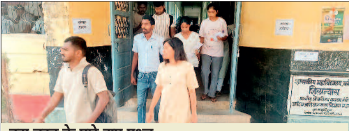
इस तरह के पूछे गए प्रश्न

रहे। 81.66 परीक्षार्थी परीक्षा में शामिल हुए। परीक्षा में नकल रोकने के लिए चार उड़नदस्ता दल अधिकारियों के बनाए गए थे। सभी परीक्षा केंद्रों में परीक्षार्थियों को कड़ी जांच से गुजरना पड़ा। जांच के लिए दोपहर 2.30 बजे से पहले बुला लिया गया था। परीक्षा के दौरान जूते या मोटे सोल वाले सैंडल, उंची हील वाले सैंडल पहनना वर्जित था। केवल पतले सोल वाली चप्पले या स्लीपर पहनने की अनुमति दी गयी थी। जूते बाहर ही परीक्षा कक्ष के पहले ही उतरवा दिए गए। बैग भी बाहर निकलवा दिए गए। हल्के रंग के आधी आस्तीन वाले कपड़े ही पहनकर आना था। चाकलेटी रंग, गहरे रंग का कपड़ा पहनकर अंदर जाने की अनुमति नहीं थी। केवल नजर के चश्मे की अनुमति अंदर जाने की थी। घूष के चश्मा या डिजिटल चश्मा पर भी प्रतिबंधित था। विवाहित महिलाओं को मंगलसूत्र पहनकर जाने की छूट दी गयी थी। पूरे प्रदेश भर में 238 सीट के लिए परीक्षा हुआ, जिसमें डिप्टी कलेक्टर के 14 पद, डीएसपी 28,